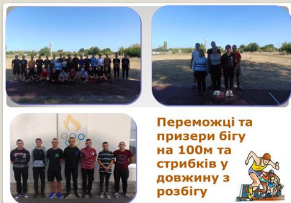
Переможці та призери бігу на 100м та стрибків у довжину з розбігу