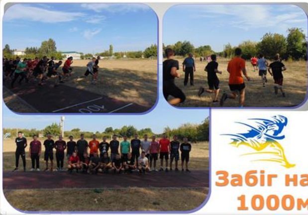
Забіг на 1000м