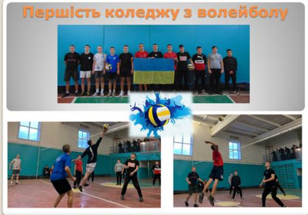
Першість коледжу з волейболу